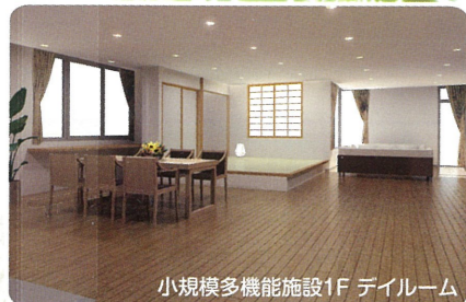
小規模多機能施設1F デイルーム