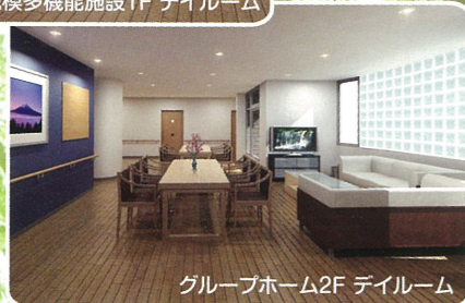
グループホーム2F デイルーム