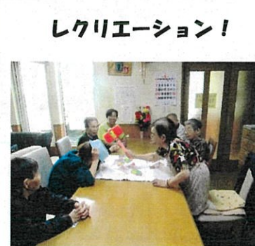
レクリエーション！

生活の流れの中で、個々の楽しみ方を尊重し、日々の状況に合わせたレクリエーションを行なっています。また季節毎に行事も予定しています。